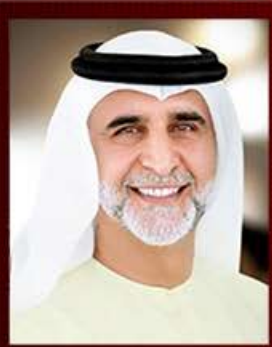
الدكتور حبيب غلوم

مخرج وممثل اماراتي عضو مؤسس لمسرح راس الخيمة الوطني يشغل منصب مستشار ثقافي أمين عام جمعية المسرحيين بدأ مشواره الفني عام 1979 وله حضوره الخاص ولمسته المميزة في كل عمل يشارك فيه مخرجا او ممثلا ،من اهم اعماله التلفزيونية حابر طاير، تماشة، حبر العيون، خيانة وطن، جواهر، لن اطلب الطلاق، احلام سعيد، بنات آدم، لو اني اعرف، قبل الاوان، هارون الرشيد كما كان له العديد من النصوص المسرحية مثل هموم صغيرة، المصير، عايشة، وماذا بعدواشرف على العديد من الدورات المسرحية التدريبية مشرفا ومحاضرا